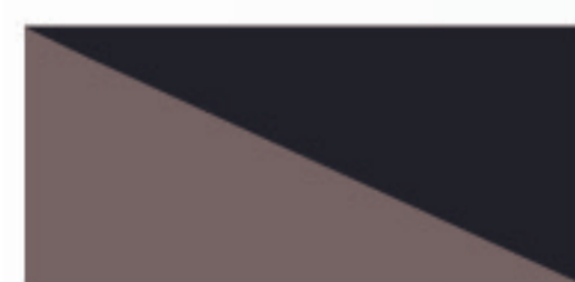
Brown + Black